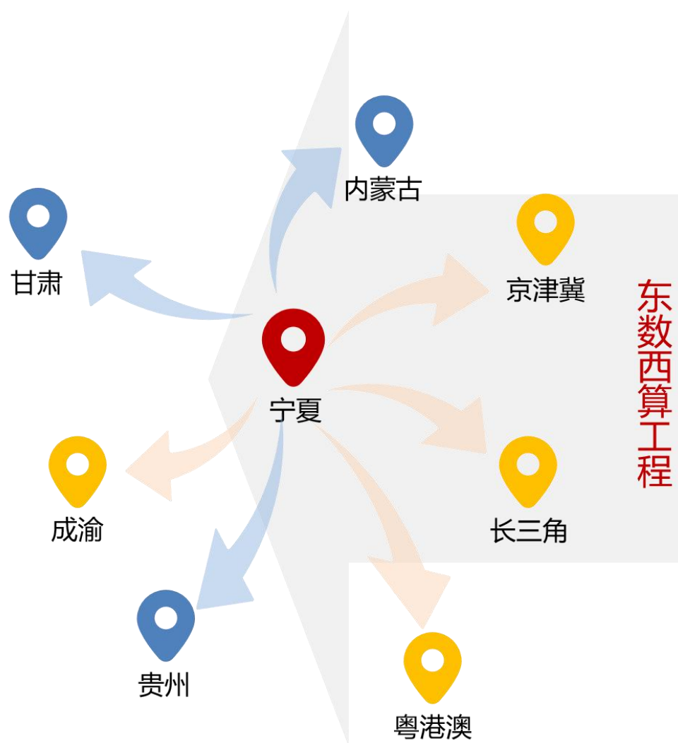
图 2 全国一体化算力网络国家枢纽节点

分析、存储备份等非实时算力需求，打造面向全国的非实时性算力保障基地。加快引入一批数据存储服务、数据中心运维等服务企业，探索引进一批服务器维修、组装、回收等企业，完善数据中心配套产业链。